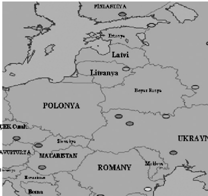
Şekil 2 Türkiye’nin Etrafındaki Nükleer Santrallerin Yerleri [7]

Şekil 2’de Türkiye’nin etrafında bulunan nükleer santrallerin yerleri gösterilmiştir.