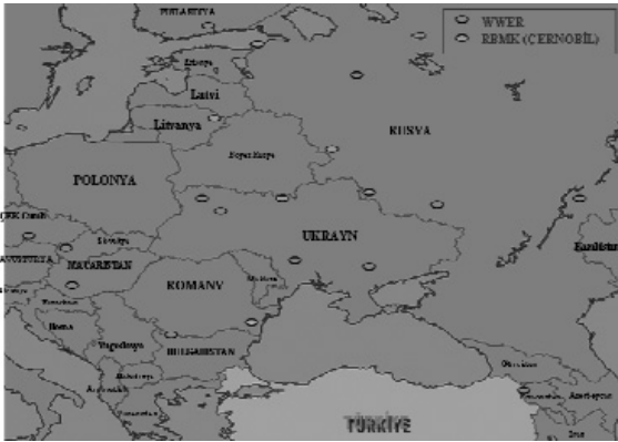
Şekil 1. Türkiye'nin etrafındaki nükleer santrallerin yerleri [7]

TAEK Ermenistan ve Bulgaristan'da bulunan Rus yapımı, VVER-440 tipi bu santrallerle ilgili inceleme başlatarak, her iki ülkenin sınırlarına monte edilen 32 istasyon aracılığıyla Radyasyon Erken uyarı ağı kurmuştur [6].